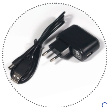
100/240V USB charger