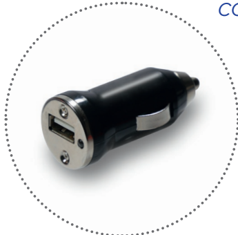
USB car charger (12/24V)

COMPLETA DI 2 CARICATORI COMPLETE WITH 2 CHARGERS